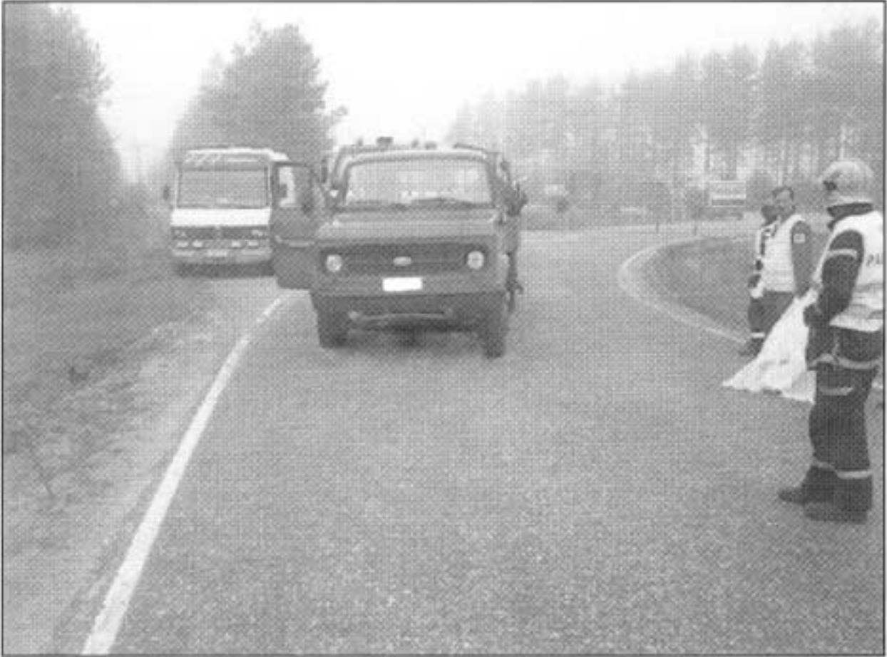
Kuva 1. Paikka, johon pienoiskuorma-auto pysähtyi onnettomuustilanteessa. Kaapelityömaa oli taustalla, missä näkyy kuorma-auto.