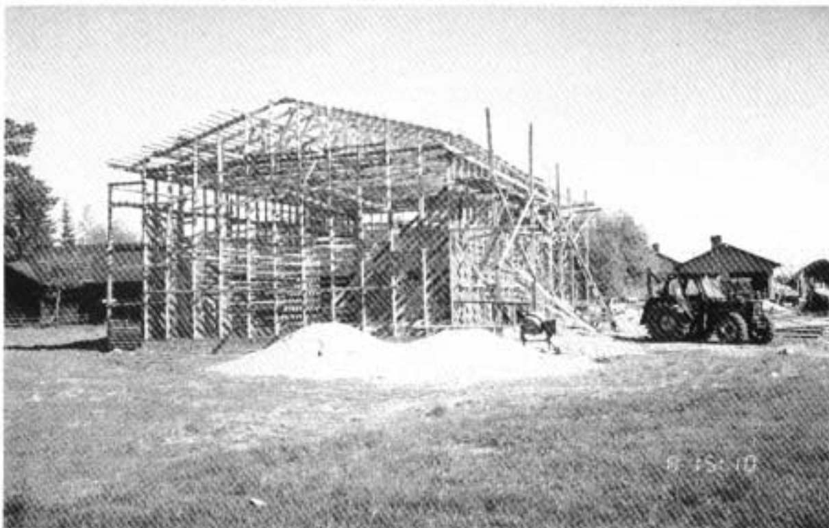
Kuva 1. Rakenteilla ollut latokuivuri. Kattoristikot ja ruoteet ovat jo paikallaan, koska kuva on otettu yli 2 viikkoa tapauksen jälkeen.