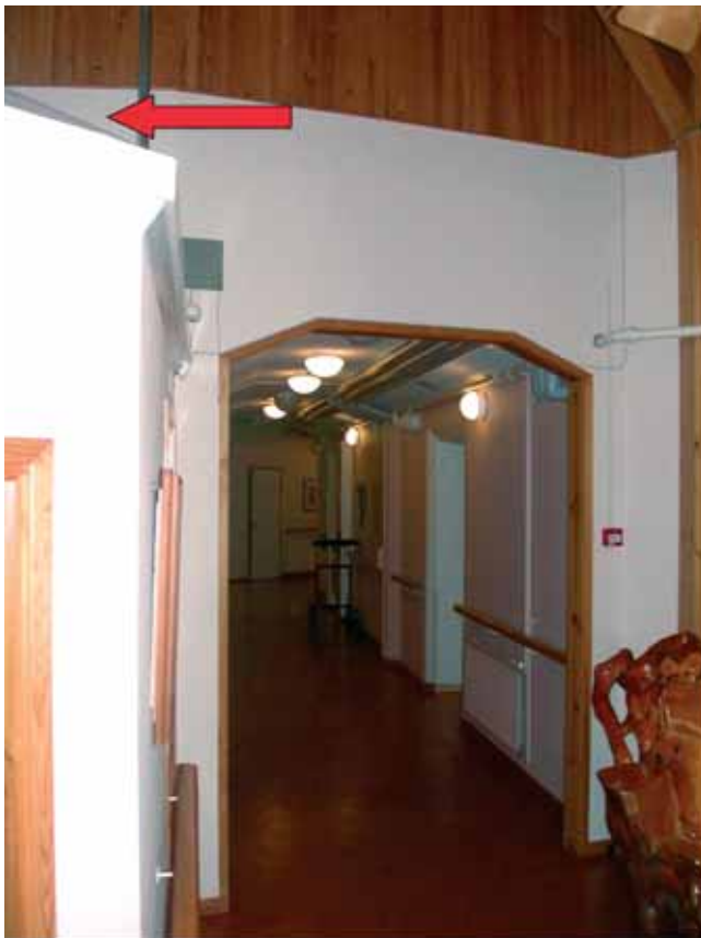
Kuva 2. Toimistotilan katto loivenee reunaa kohti 0,5 metrin matkalla n. 0,4 metriä (nuoli). Luiska on samanvärinen muun katon kanssa, eikä siinä ole merkintää loivenemisesta, joten luiskaa ei ole kovin helppo havaita. Reunaa ei ole merkitty mitenkään. Katon reunalla ei ole kaiteita tms. putoamisen estäviä rakenteita.