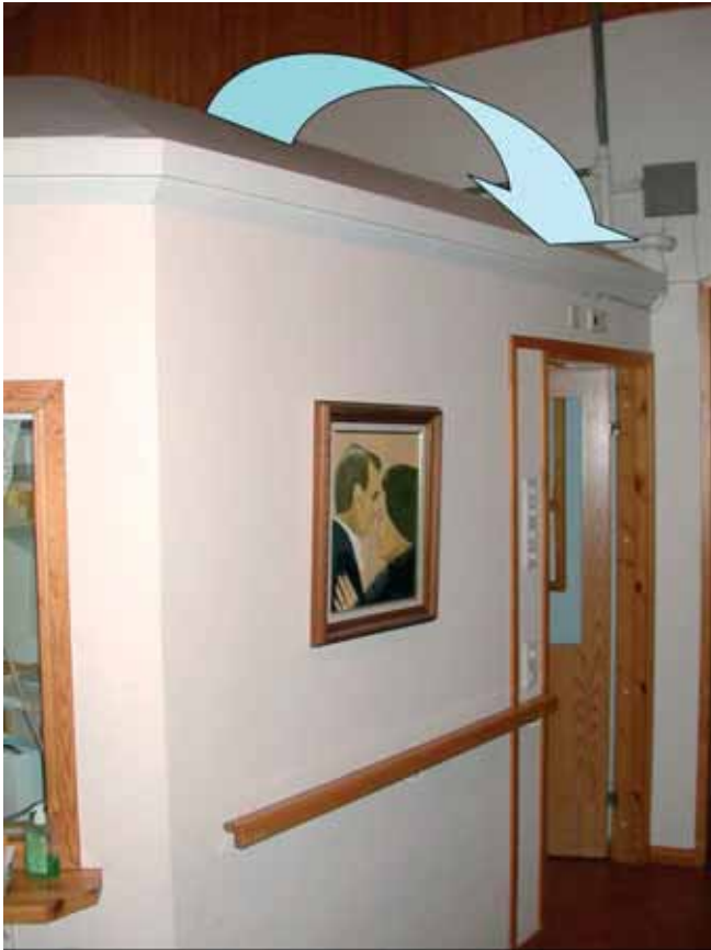
Kuva 1. NN putosi vanhainkodin toimistotilan katolta.