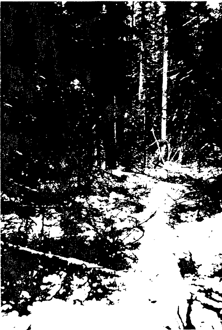
Kuva 1. Näkymä KK:n kaataman puun kannolta. N.N:n tulosuunta merkitty nuolella.