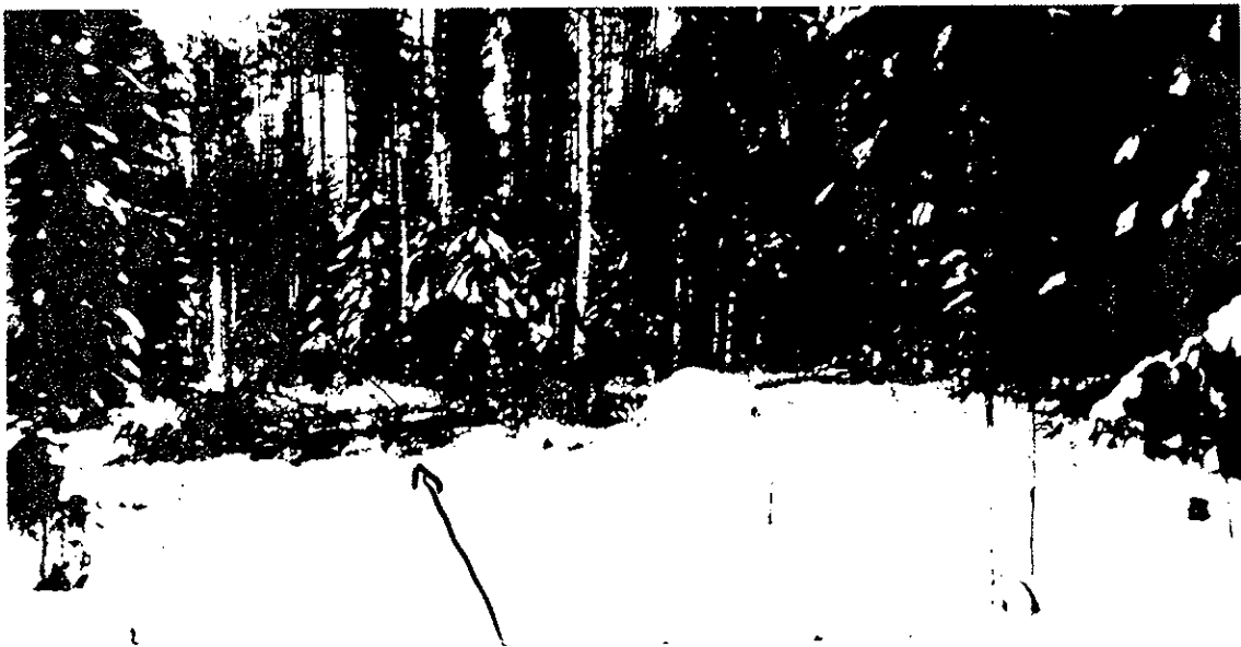
Kuva 2. N.N:n kulkusuunta ja allejäämisaikka.